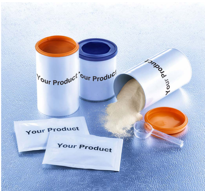
图.SternMaid 生产的一些最终包装产品的示例

成立于1934年的Russell Finex是筛分和过滤技术的全球品牌，其产品包括各种各样的振动筛、分级筛和自清洁式液体过滤器。凭借其85年的经验，该公司不仅是供应商，还是创新者和顾问，它服务于包括食品和饮料行业，医药行业，涂料行业，陶瓷行业以及金属粉末行业在内的各种不同行业。欲了解有关机器如何帮助满足您的具体要求的更多信息，敬请即刻联系我们。