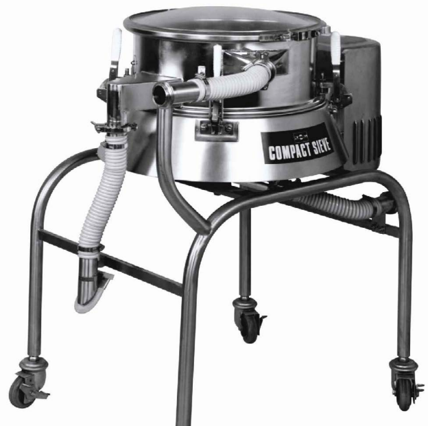
图1. Compact Airswept Sieve™ 紧凑型气扫振动筛

Russell Finex推荐600mm Compact Airswept Sieve™ 600毫米